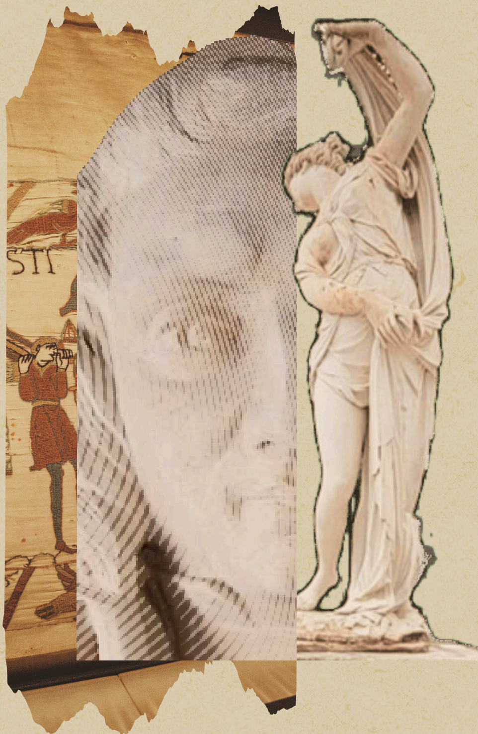
Tapiserie de Bayeux - licence : 2382154.815. Visage central, statue de la façade de l'aile Rohan au Louvre, Statue central d'une femme du Jardin des Tuileries au Louvre