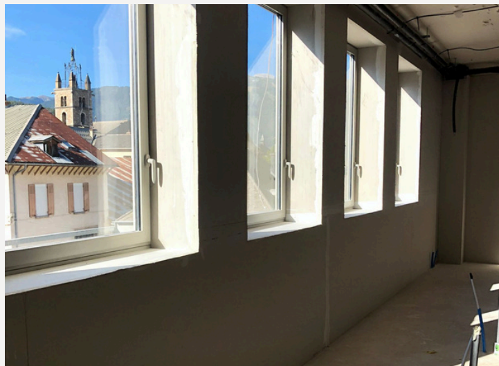
Lycée André Honnorat à Barcelonnette - photo extérieure et intérieure bâtiment 2-8B

Deltexplan intervient en tant qu'OPC dans le cadre d'un projet de Restructuration et extension du lycée André Honnorat de Barcelonnette pour s'adapter aux évolutions pédagogiques. Une modernisation des 5 bâtiments y compris : l'enseignement, la restauration, le logement, le gymnase, le CDI, la loge et la chaufferie.