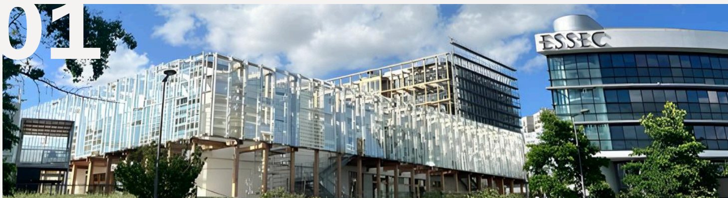
ESSEC Business School à Cergy - photo Deltexplan

Deltexplan intervient en tant qu'OPC pour moderniser les infrastructures du campus. La rénovation des bâtiments, l'expansion des espaces, l'intégration de la durabilité, ainsi que l'amélioration de la vie étudiante grâce à de nouvelles installations et services, notamment la construction de la Tour Verte de Recherche et du Centre d'Apprentissage Créatif.