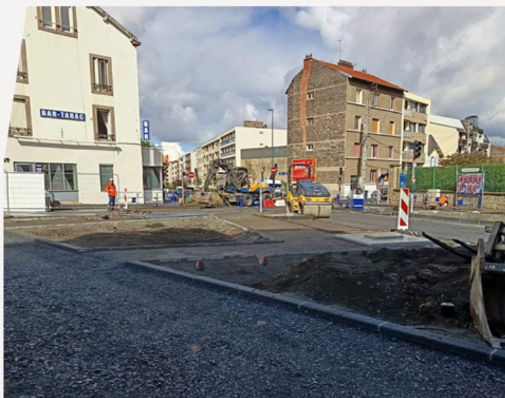
Piste cyclable rue Poncillon à Clermont-Ferrand

Deltexplan intervient en tant qu'OPC et également en mission OPC-IC dans le projet d'aménagement d'une piste sécurisée près de l'école Édouard-Herriot, incluant une piste cyclable de 300 mètres et le maintien de la circulation à double sens. Le projet prévoit également l'ajout de quinze arbres. Cette piste reliera la future piste cyclable de la rue Poncillon vers le Boulevard Joseph-Giroud.