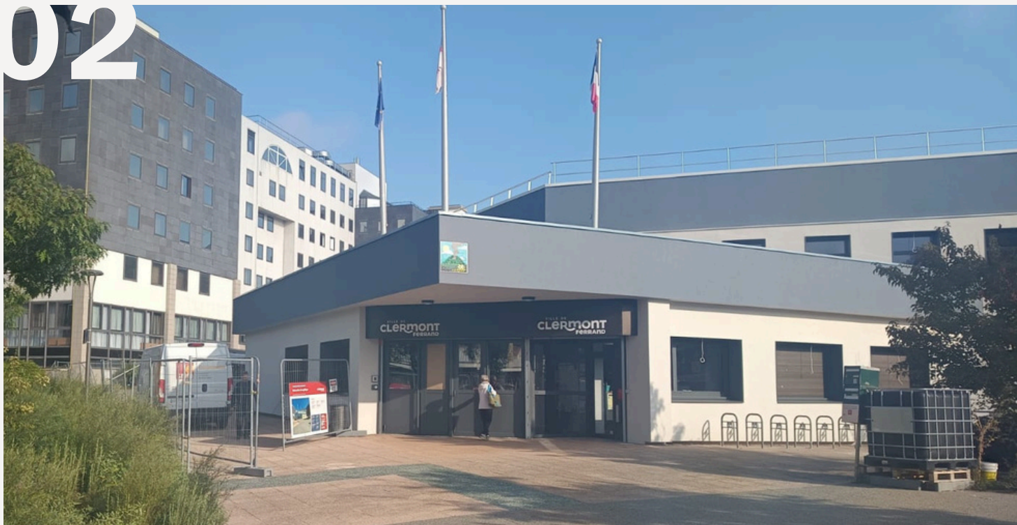
Gymnase Jean Fleury à Clermont-Ferrand - Entrée du gymnase

Deltexplan intervient en tant qu'OPC dans le cadre d'un projet de rénovation énergétique du gymnase Jean Fleury en un espace moderne et éco-responsable. En collaboration avec divers professionnels, l'équipe vise à minimiser les perturbations pour les utilisateurs. Des solutions innovantes d'économie d'énergie seront mises en œuvre pour garantir un bâtiment durable, respectant les normes environnementales et offrant aux habitants de Clermont-Ferrand un lieu de sport moderne.