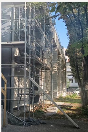
Gymnase Jean Fleury à Clermont-Ferrand - Façade du gymnase