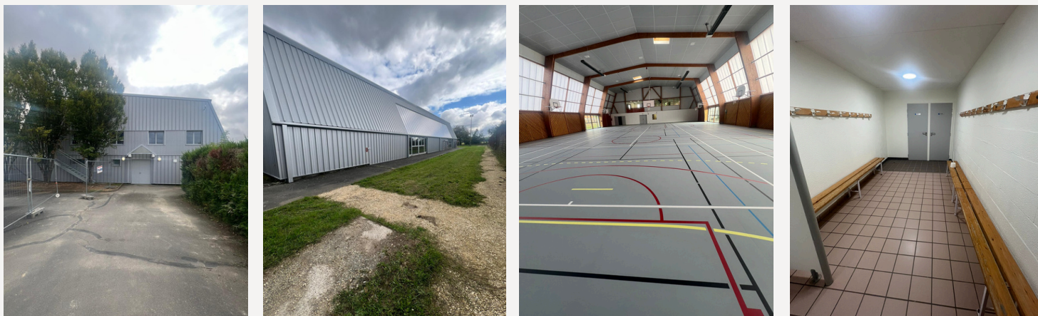
Espace extérieur et intérieur du gymnase du Collège Joseph Crocheton

Deltexplan intervient en tant qu'OPC dans le cadre d'un projet de rénovation scolaire, incluant l'intégration d'un internat, l'ajout de 7 classes, un programme d'arts plastiques, la rénovation d'un gymnase, et la construction d'un bâtiment administratif biosourcé, visant à créer un environnement stimulant et inclusif.