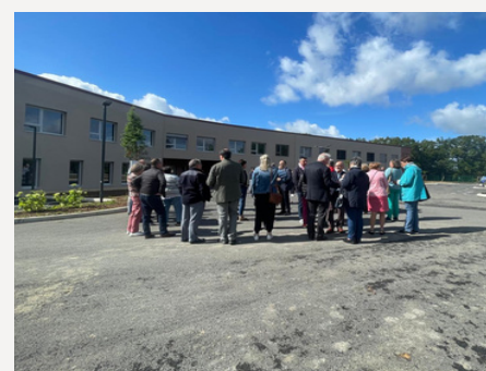
EHPAD - Rassemblement des élus