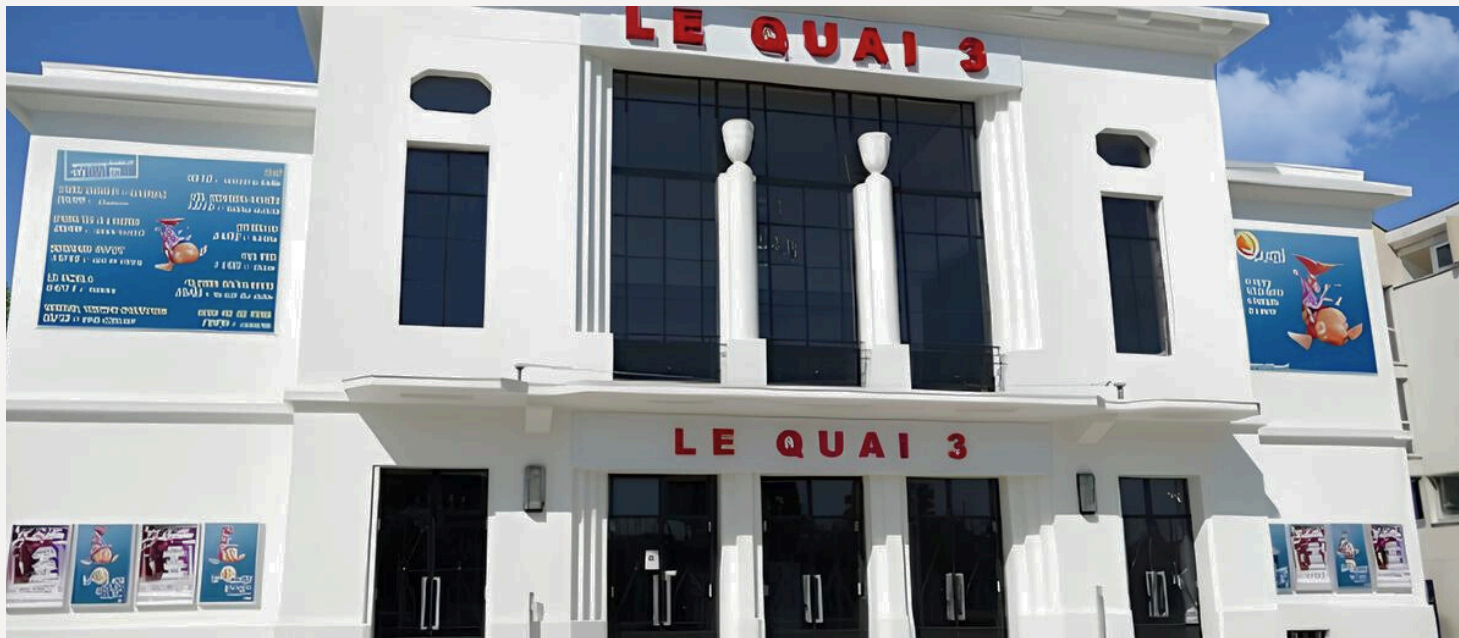
Salle de spectacle Le Quai 3 - Le Pecq

DELTEXPLAN agit en tant qu'OPC pour un projet de rénovation en cours concernant la salle de spectacle "Le Quai 3". L'objectif est d'améliorer l'accessibilité, la capacité d'accueil, la visibilité des spectateurs, ainsi que les outils et les fonctionnalités techniques. La capacité maximale d'accueil du public est de 660 personnes.