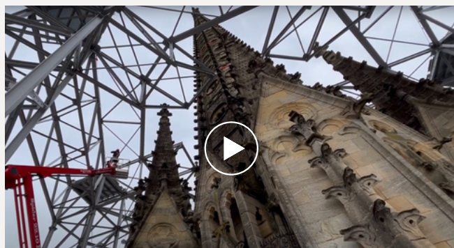
Une vidéo sur la flèche Saint-Michel est disponible sur notre chaîne YouTube.

Après 20ans de création, la Consécration* de la flèche de l'église Saint-Michel, un clocher gothique flamboyant qui atteint 114 mètres de hauteur. Cette flèche est devenue un des symboles architecturaux de la ville.