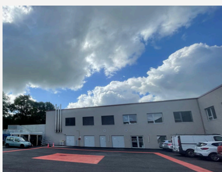
EHPAD - Résidence Marie de Seuly