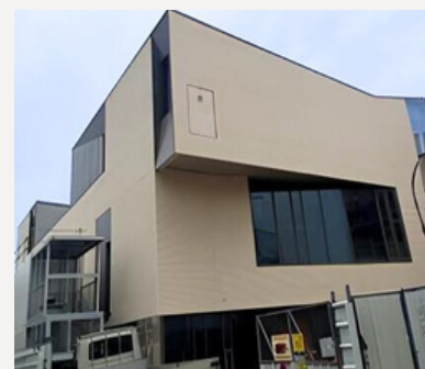
Conservatoire de Musique du Pré Saint-Gervais