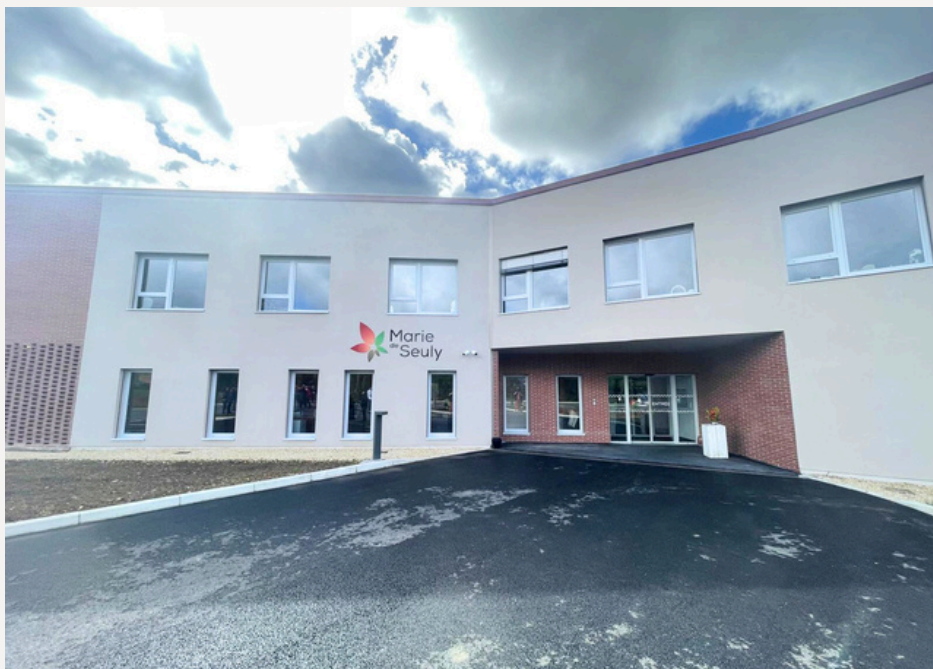
EHPAD - Résidence Marie de Seuly - photo DELTEXPLAN