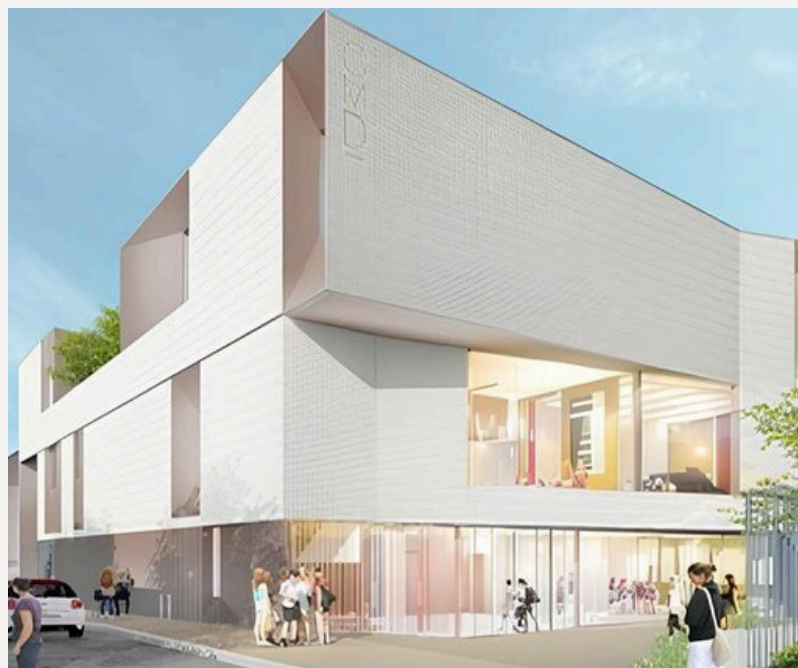
Conservatoire de Musique du Pré Saint-Gervais - Maquette